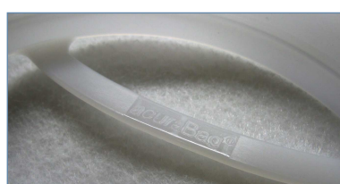
Formteil mit Handgriff