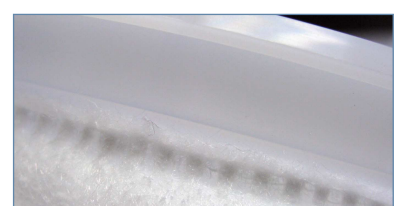
Verschweißung Formteil/ Filtermaterial

Technische Änderungen vorbehalten. AL1007-05