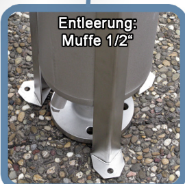
Entleerung: Muffe 1/2"