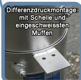
Differenzdruckmontage: mit Schelle und eingeschweissten Muffen