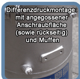
Differenzdruckmontage: mit angegossener Anschraubfläche (sowie rückseitig) und Muffen