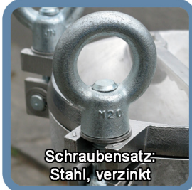
Schraubensatz: Stahl, verzinkt